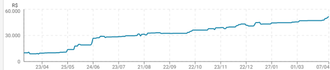
Evolução do patrimônio

Por isso, nossas operações são mais assertivas e tem uma taxa de lucro muito superior a outras estratégias do mercado.